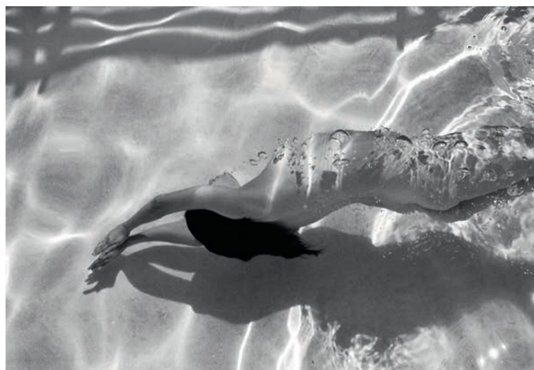
Badenixen am Pool: Durch einen Zufall entdeckte Deanna Templeton das faszinierende Zusammenspiel von Körpern, Wasser und Licht (Seite 52)