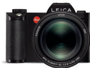
Ein Telezoom für die Leica SL: das APO-Vario-Elmarit-SL

Spektivadapter für die Leica Q und ein M-Objektiv zum selbst bauen