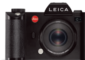
Es muss nicht immer das Systemobjektiv sein: SL mit Summilux-TL

Ein neues Gewand für die Website des S Magazins