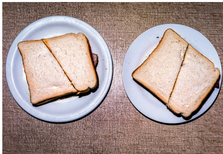
In Englands Black Country begann vor über zwei Jahrhunderten die industrielle Revolution – Bruce Gilden fotografierte, was von ihr übrig blieb (Seite 38)