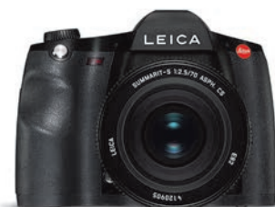
Der GPS-Buckel ist weg: die Silhouette der neuen Leica S

An der Leica M setzt Paul Ripke ausschließlich das 24er-Summilux ein