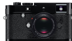
Auch die Leica M-P macht der Messucher einzigartig

Speichern, bearbeiten, verwalten: die neue Leica Onlineplattform