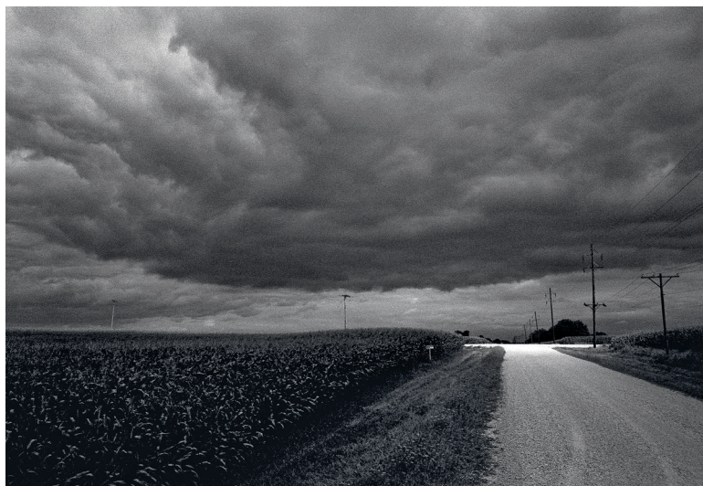
Road to Nowhere? Danny Wilcox Frazier kehrte in seine Heimat Iowa zurück und porträtierte Veränderungen und Traditionen (ab Seite 62)