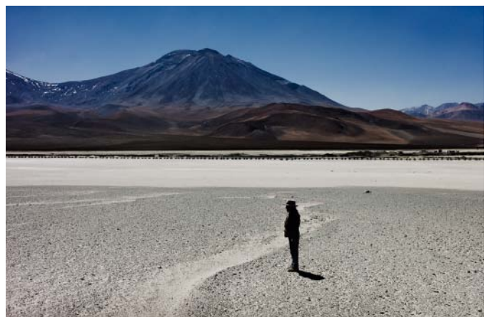
Constantine Manos: Moskau 1965 (S. 10) M-Sortiment: Leichtgewicht 2.8/28 mm, Schwergewicht 0.95/50 mm (S. 40) Tomás Munita: in der Atacama-Wüste (S. 26)