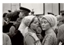
Constantine Manos: aus der Serie „Moskau 1965“