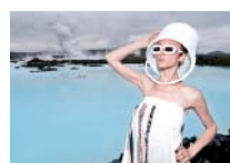
Daniel Josefsohn: aus der Serie „Eyes Land“, 2010