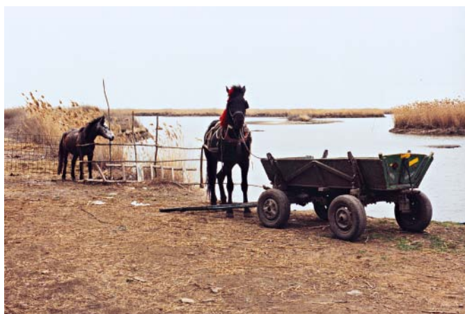
Björn Vaughn: Parkhaus-Shooting mit der SK-Clikk, 2008 (Seite 6) Blitz: neu. Super-Elmar-M: neu (Seite 30 und 32) Irina Ruppert: Rumänien, Jurilovca, 2009 (Seite 52)